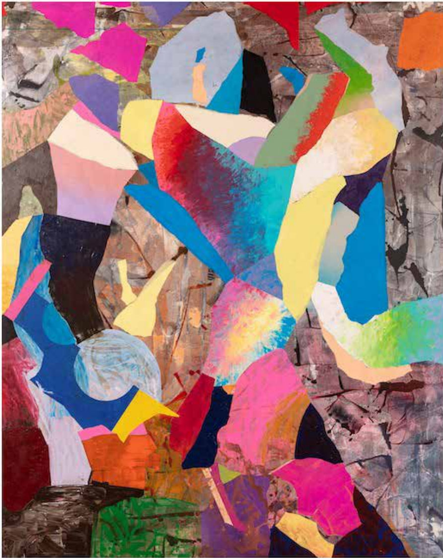
Acrílico sobre tela 197x159 2020