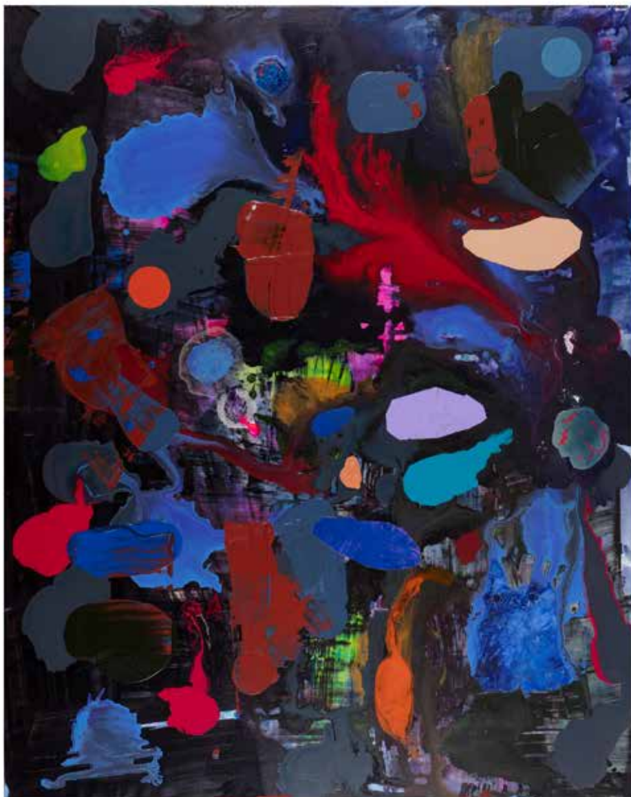
Acrílico sobre tela 198x150 2019