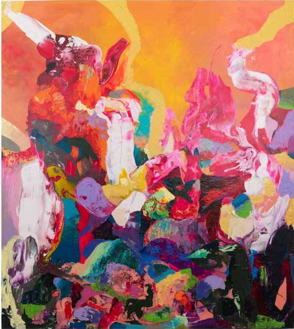
Acrílico sobre tela 190x170 2020