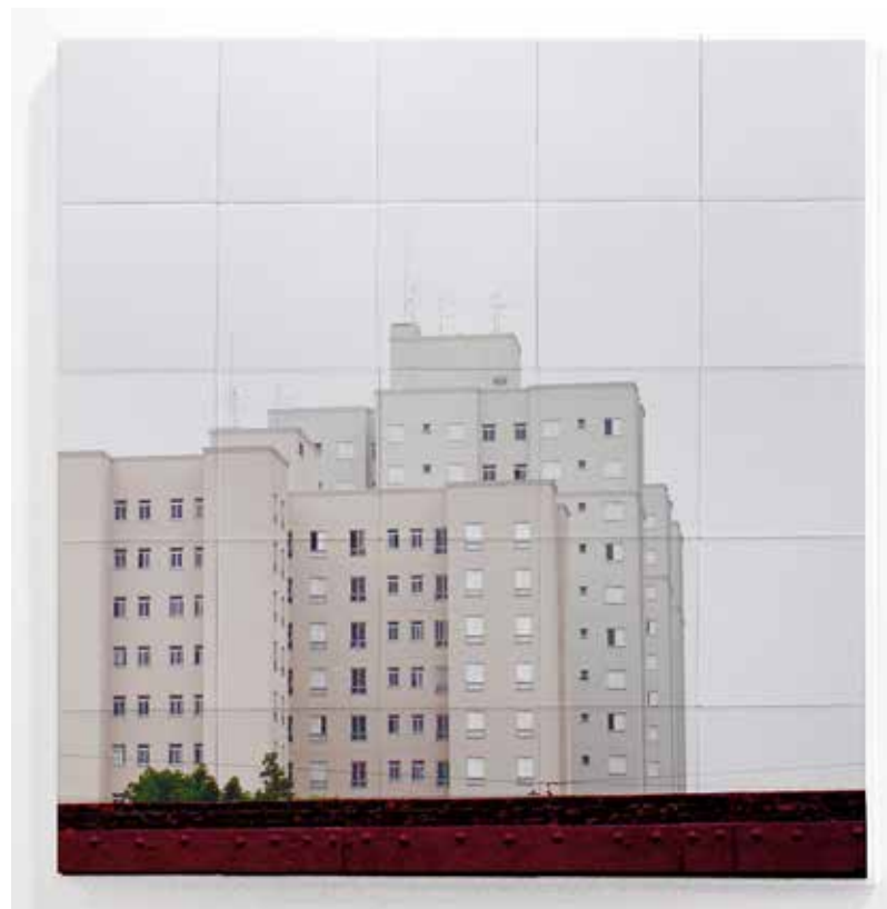
Mural en Azulejos I y II | 25 piezas de azulejos de 15 x 15 cm c. u. impresos por medio de inyección de tinta. 76 x 76 x 4 cm. 2014.