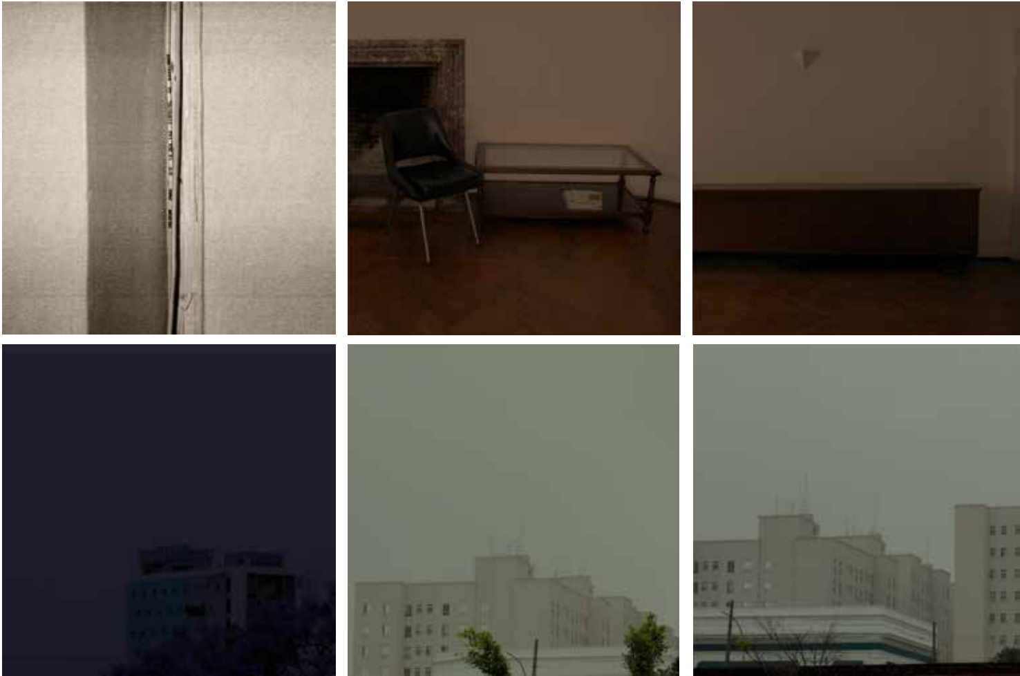
Serie en tránsito | Fotografía Color digital impresión Glicée. Epson Velvet Somerset 255g. 20 x 20 cm c/u. 2011.