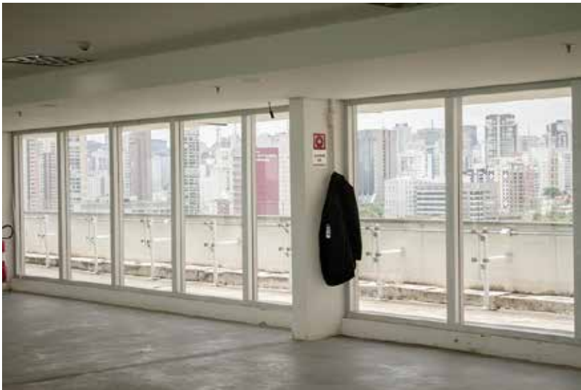
Chroma Key (2) Fotografías color digital Dimensiones variables 2017